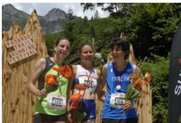
Najboljše tri ženske na Svetovnem prvenstvu 2016