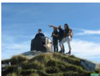
Železna kupola na Lajnarju

Danes pa festival tekačem ponuja 4 različno dolge teke, UPT 100km (Ultra pušeljc trail), GM40 42 km (Gorski maraton 4 občin), GT 12 km (Graparski trimček) in od 1 do 3km MINI GM40 (za najmlajše in mladostnike). Vse trase se tesno prepletajo z zgodovino rapalske meje, tekače na nekaterih odcepih vodijo skoraj skozi skrivnostne kasarne in bunkerje.