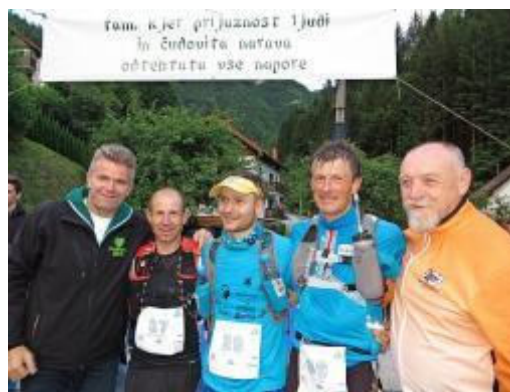
Sprejem prvih tekmovalcev v cilju na UPT