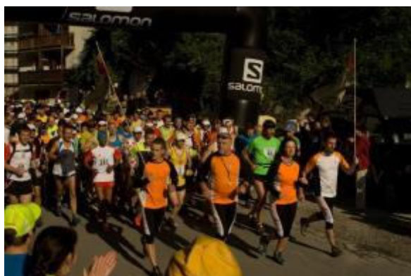
Start skupaj z glavnimi organizatorji