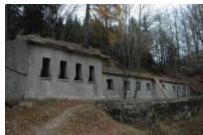
Kasarna pri Robarju

Poleg tekaškega dela pa obiskovalcem ponujamo tudi glasbeno - kulturne in dobrodnele prireditve skozi celoten vikend.