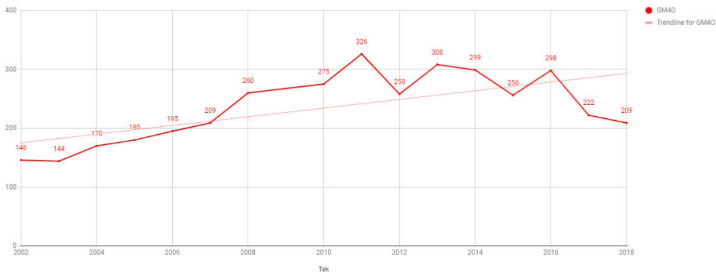
Gorski Maraton 4 Občin - Udeležba po letih